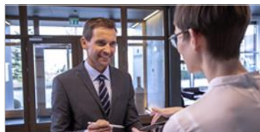
Besuchermanagement ELO Visitor