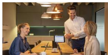
Wissensmanagement ELO Knowledge