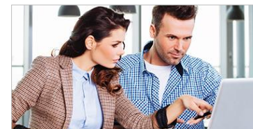
Weiterbildungsmanagement ELO Learning