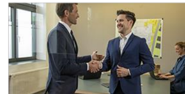
Bewerbermanagement ELO HR Recruiting