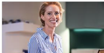
Rechnungsmanagement ELO Invoice & ELO for DATEV

Best-Practice Lösungen für Ihre Fachabteilungen