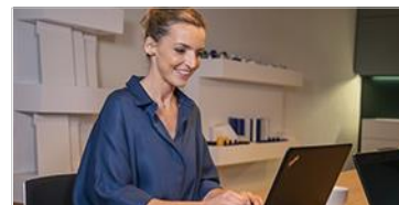
Sitzungsmanagement ELO Meeting