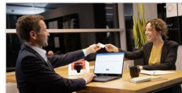
Digitale Personalakte ELO HR Personnel File