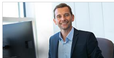
Vertragsmanagement ELO Contract