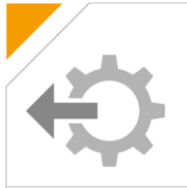
ELO Output Link for *