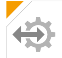
ELO Datatransfer for *