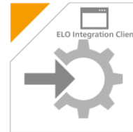
ELO Integration Service for *