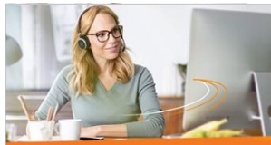
Weiterbildungsmanagement Mit ELO Learning