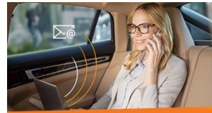
E-Mail Management Mit ELO