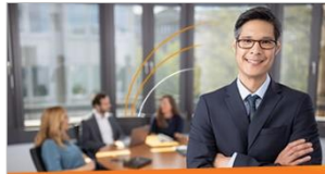
Digitale Personalakte Mit ELO HR Personnel File