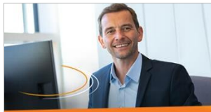
Vertragsmanagement Mit ELO Contract