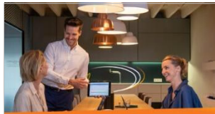
Wissensmanagement Mit ELO Knowledge