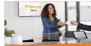
Besuchermanagement Mit ELO Visitor