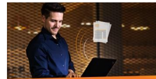
Digitaler Posteingang Mit ELO DocXtractor