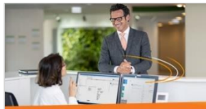
E-Akte Mit ELO Public Sector