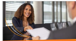
Bewerbermanagement Mit ELO HR Recruiting